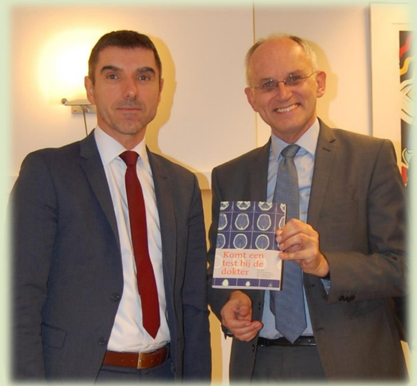
Aanbieding van Komt een test bij de dokter aan Staatssecretaris Paul Blokhuis van VWS.

De bij ZonMw ingediende onderzoeksaanvraag getiteld 'Spoken uit het verleden. Formatieve ervaringen met sterfbedden en hun implicaties voor advance care planning' mocht worden uitgewerkt, maar ontving helaas evenmin subsidie.